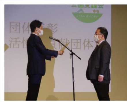
【代表して市長から表彰状を授与】