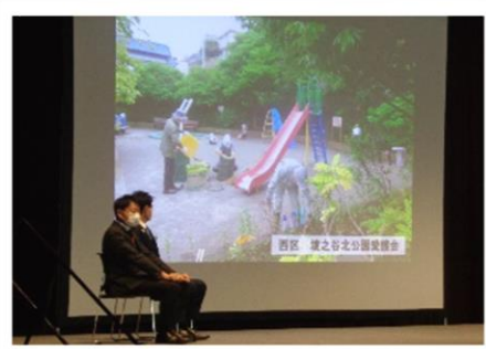
【モニターに写された活動風景】