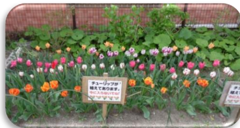
22年春の花壇の様子