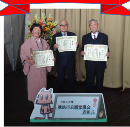
【3人揃って、笑顔で記念撮影】